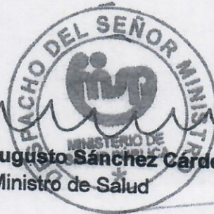
Dr. Rafael Augusto Sánchez Cárdenas Ministro de Salud