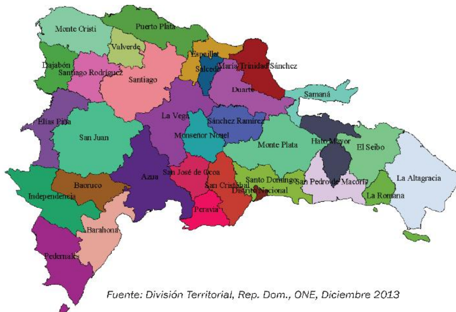
Fuente: División Territorial, Rep. Dom., ONE, Diciembre 2013