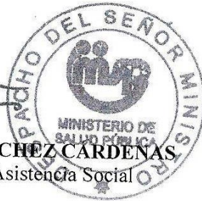
DR. RAFAEL AUGUSTO SÁNCHEZ CARDENAS Ministro de Salud Pública y Asistencia Social

DADA, FIRMADA Y SELLADA, en Santo Domingo de Guzmán, Distrito Nacional, Capital de la República Dominicana, a los diecinueve ( 19 ) días del mes de junio del año dos mil dieciocho (2018).